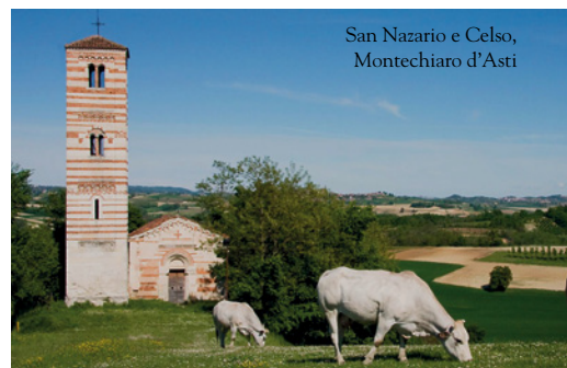
San Nazario e Celso, Montechiaro d'Asti