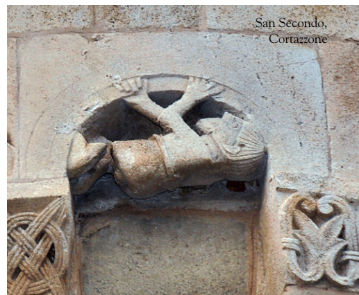
San Secondo, Cortazzone