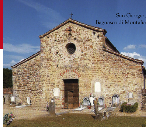
San Giorgio, Bagnasco di Montafia

Italian Wine Travels Agenzia Viaggi, Tour Operator Via San Cafasso 41, 14022 Castelnuovo Don Bosco (AT) tel. 011 9927028 - fax 011 9927144 e-mail: info@italianwinetravels.it