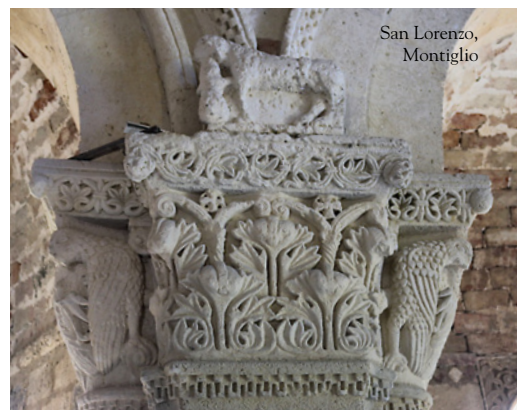
San Lorenzo, Montiglio